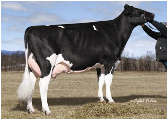
MS WELCOME COLBY TAYA FIFTH DAM